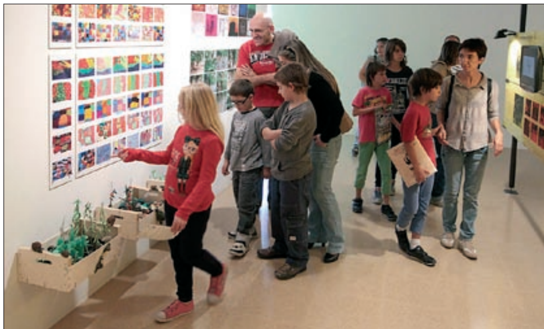
L'exposició "Art+Escola+Entorn", inaugurada diumenge al matí, es podrà visitar fins al dia 5 de gener